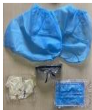
真空パックにて包装